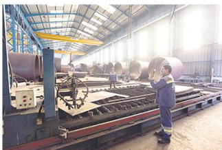
Les liaisons organiques entre les PME et les grands programmes (ici la production de DLM de mâts pour l'électricité éolienne) ou les grandes entreprises sont essentielles pour que le nouveau programme industriel porte

C'est à ce niveau que les missions du CNCE trouvent leur expression, car le conseil s'inscrit dans une démarche d'intelligence économique autour de trois volets: traiter l'information pour l'aide à la décision, assurer la sécurité économique des entreprises et renforcer l'influence de notre pays. Enfin, la lutte contre l'informel traduit une vision large et approfondie de la stratégie industrielle et ce, par la reprise d'un secteur industriel structuré et par la reconquête de notre marché intérieur à condition, bien entendu, de produire dans des conditions de prix et de qualité compétitives. Le marché intérieur est intéressé à la stratégie industrielle en prenant en considération la dimension régionale à travers le couple territoire-industrie. La compétitivité est également une question d'organisation économique. La conquête du marché intérieur facilite celle des marchés extérieurs, le prisme de l'intégration locale ne peut être efficace que si nos produits sont de qualité et compétitifs quelle que soit leur destination, marché domestique ou exportation, car on est