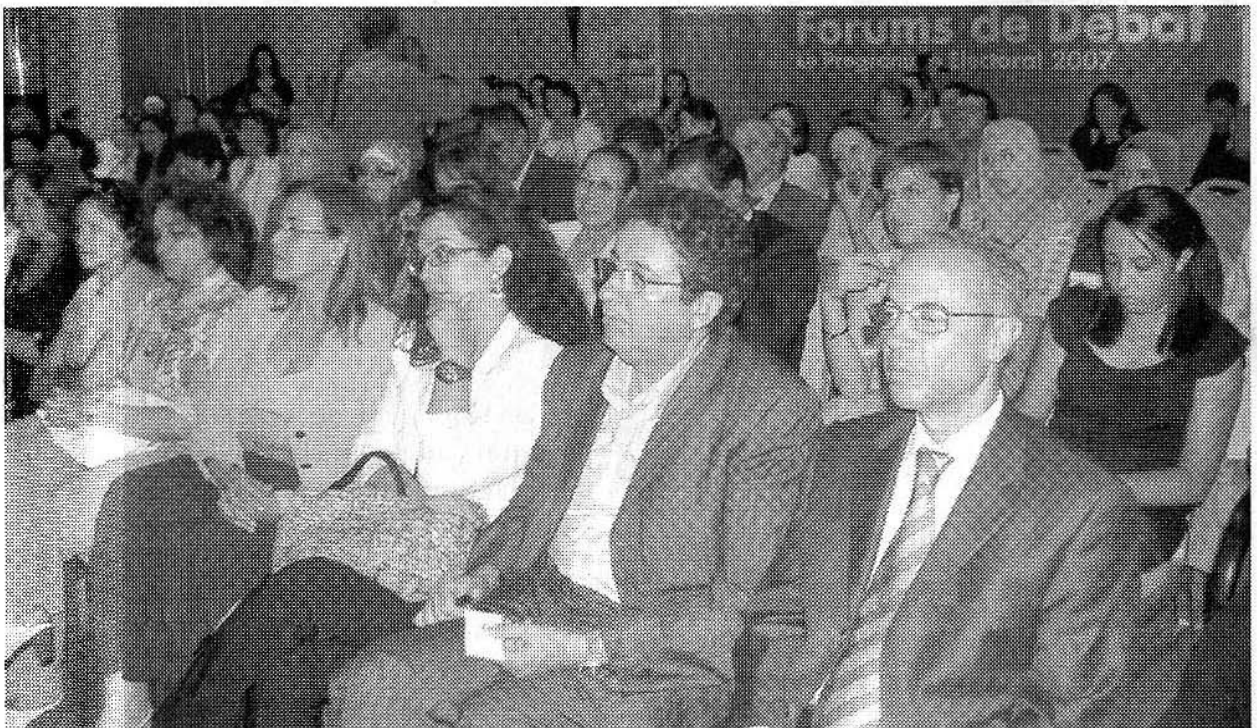
Rencontre de l'USFP à Casablanca le 19 juillet 2007.

Le repositionnement de l'économie à travers le programme «Emergence» est en train de se faire autour de grands secteurs considérés comme les métiers mondiaux du Maroc : offshoring, industrie automobile, aéronautique... mais de nombreuses questions restent posées :