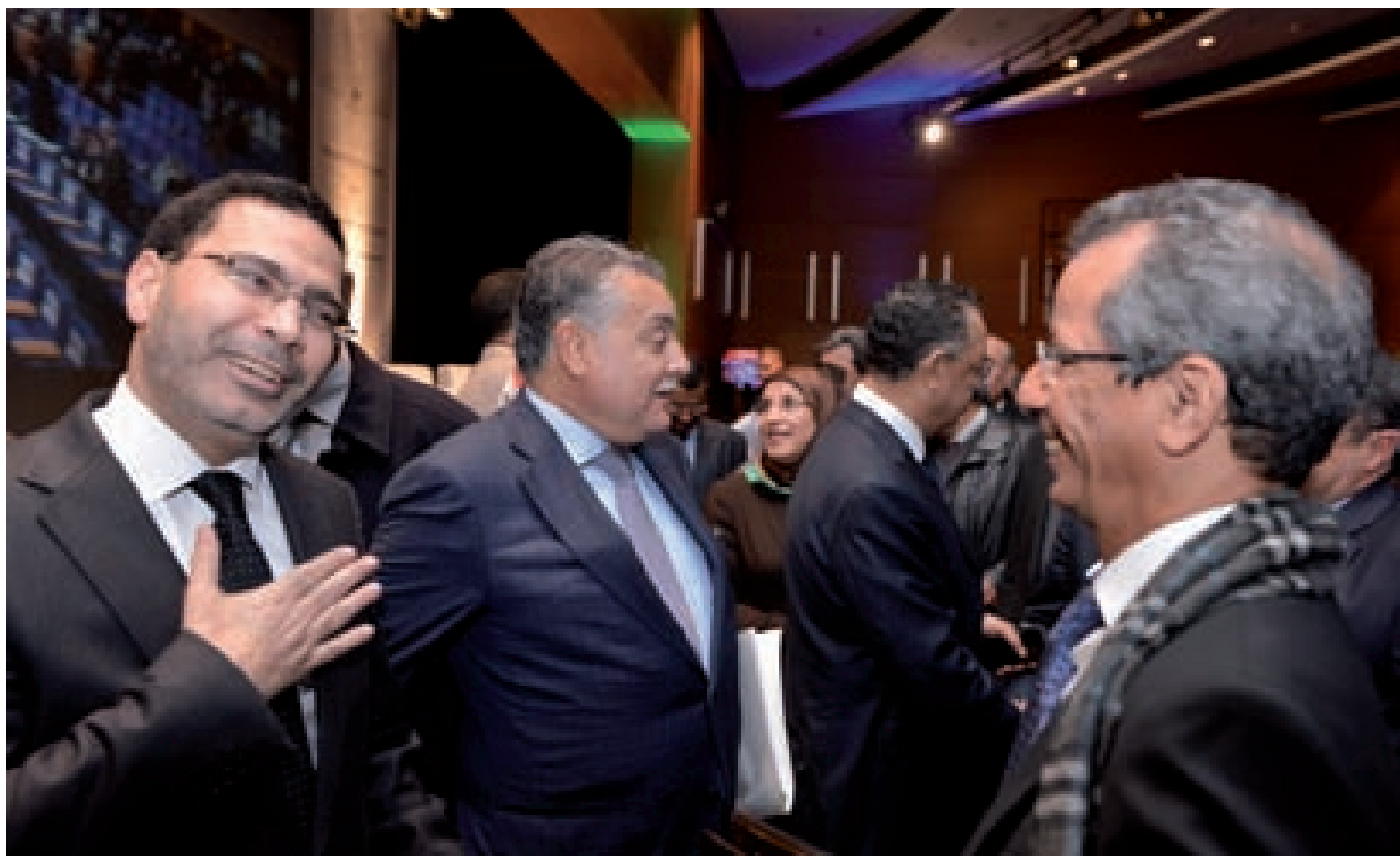
Plusieurs ministres et patrons d'entreprises publiques étaient présents lors des assises.

Sur le plan international, la stratégie qui a dominé jusqu'à présent, a consisté à réduire le rôle de l'Etat et son désengagement. Cela s'est fait sous des formes diverses selon les grammaires nationales. D'ailleurs certaines économies émergentes combinent capitalisme privé et capitalisme d'Etat et réalisent des résultats appréciables.