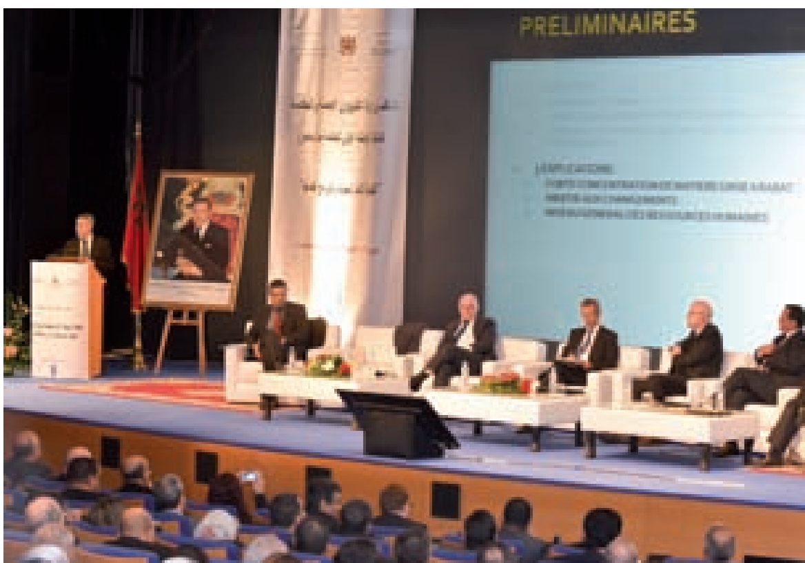
Les différents intervenants en mis en exergue l'importance de la qualification des ressources humaines pour la réussite du pari de la gouvernance.

tifier des objectifs clairs de l'évolution du PIB de chaque secteur et surtout son partage entre la production destinée au marché locale et celle orientée vers les exportations. Or, les différents plans sectoriels ne sont